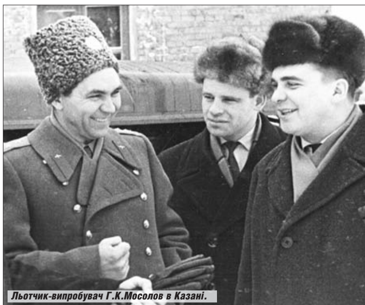
Льотчик-випробувач Г.К.Мосолов в Казані.

За роки льотно-випробувальної роботи Георгій Костянтинович здійснив перший виліт та провів льотні випробування пер-